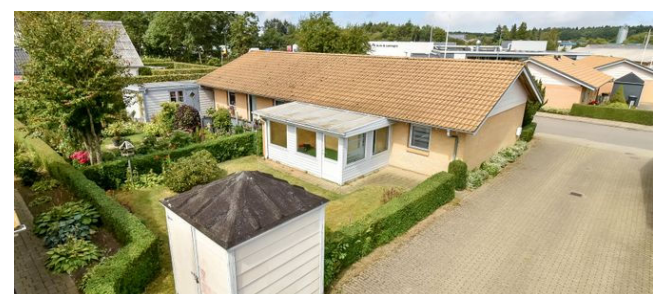
Give Frederiksberggade 51A

Ejd.type Boliglandbrug Grund m 2 563.959 Bolig m 2 153 Værelser 5 Energimærke D