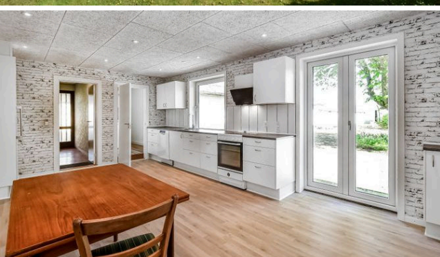
Øgelund Øgelundvej 83