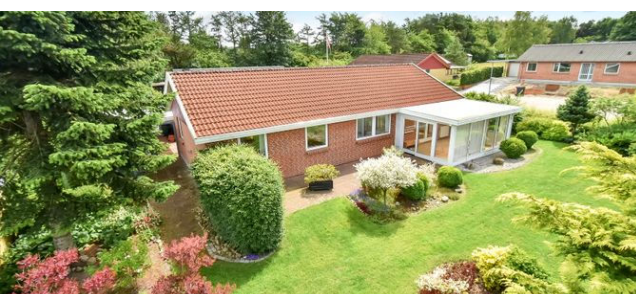
Thyregod Skovlunden 103

Ejd.type Boliglandbrug Grund m 2 91.668 Bolig m 2 78 Værelser 5 Opført/ombygget 1877/1975