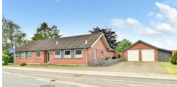
Vonge Bygade 16