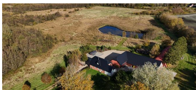
Ullerup Ullerupvej 10

Ejd.type Villa Grund m 2 900 Bolig m 2 112 Værelser 4 Energimærke C