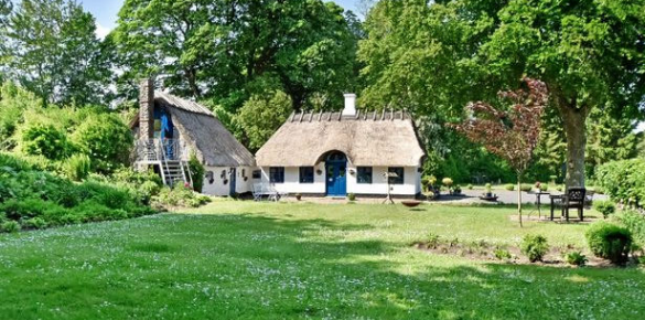
Give Grønborgvej 21