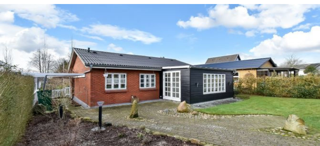
Give Skovbakken 10 Sagsnr. 501-5468