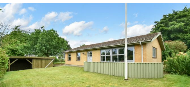
Givskud Stadionvej 22 Sagsnr. 501-5108

Ejd.type Villa Grund m 2 1.348 Bolig/kælder m 2 96/40 Værelser 3 Energimærke D