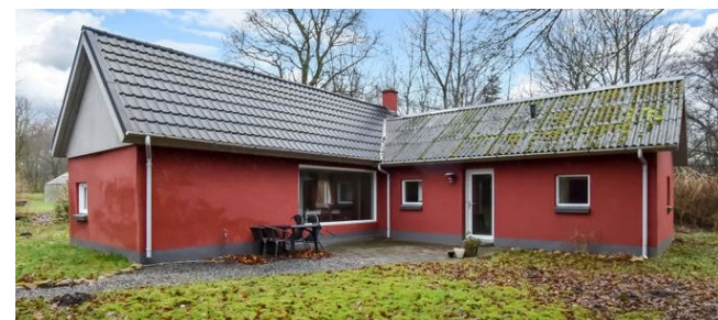
Tøsby Tøsbygårde 1 Sagsnr. 501-5469

Villa med naturskøn grund og stort værksted