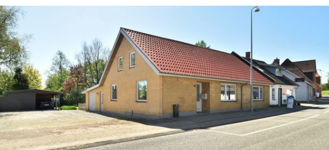
Gadbjerg Langgade 39

Ejd.type Villa Grund m 2 1.008 Bolig/kælder m 2 195/4 Værelser 6 Energimærke C