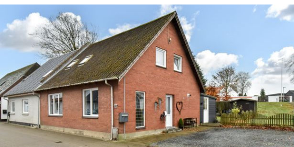
Thyregod Borgergade 5

Ejd.type Villa Grund m 2 1.051 Bolig m 2 157 Værelser 6 Energimærke E