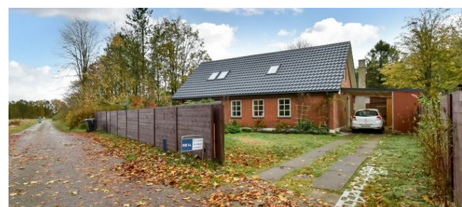
Langelund Blæsbjergvej 18