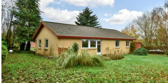
Kollemorten Smedevænget 25