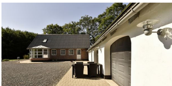
Thyregod Ålbækvej 23