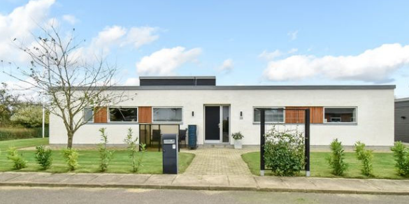
Kollemorten Toften 38