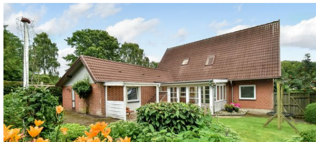
Give Diagonalvejen 72

Ejd.type Villa Grund m 2 19.985 Bolig/kælder m 2 139/6 Værelser 5 Energimærke E