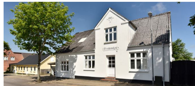
Give Frederiksberggade 34

Ejd.type Villa Grund m 2 1.135 Bolig/kælder m 2 185/12 Værelser 6 Energimærke D