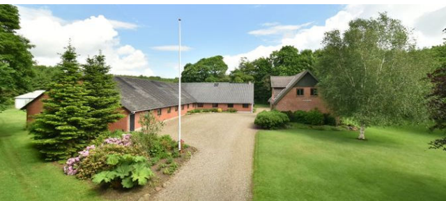
Kollemorten Riisvej 21