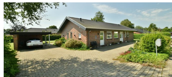
Give Ringparken 20 Sagsnr. 501-5132

Ejd.type Villa Grund m 2 986 Bolig/kælder m 2 85/85 Værelser 2 Energimærke C