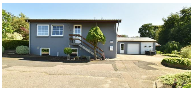
Give Rådhusbakken 21 Sagsnr. 501-5335

Ejd.type Villa Grund m 2 5.005 Bolig/kælder m 2 122/122 Værelser 3 Energimærke B