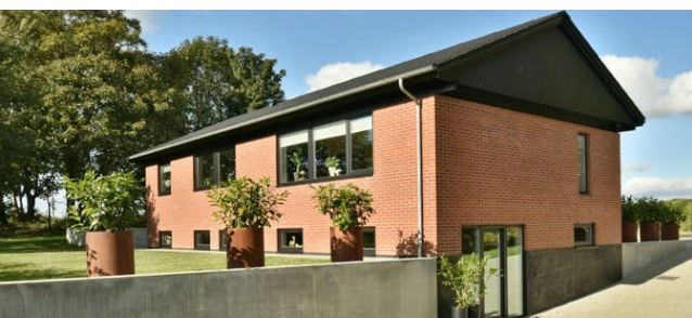
Ullerup Ulleruplund 1 Sagsnr. 501-5391